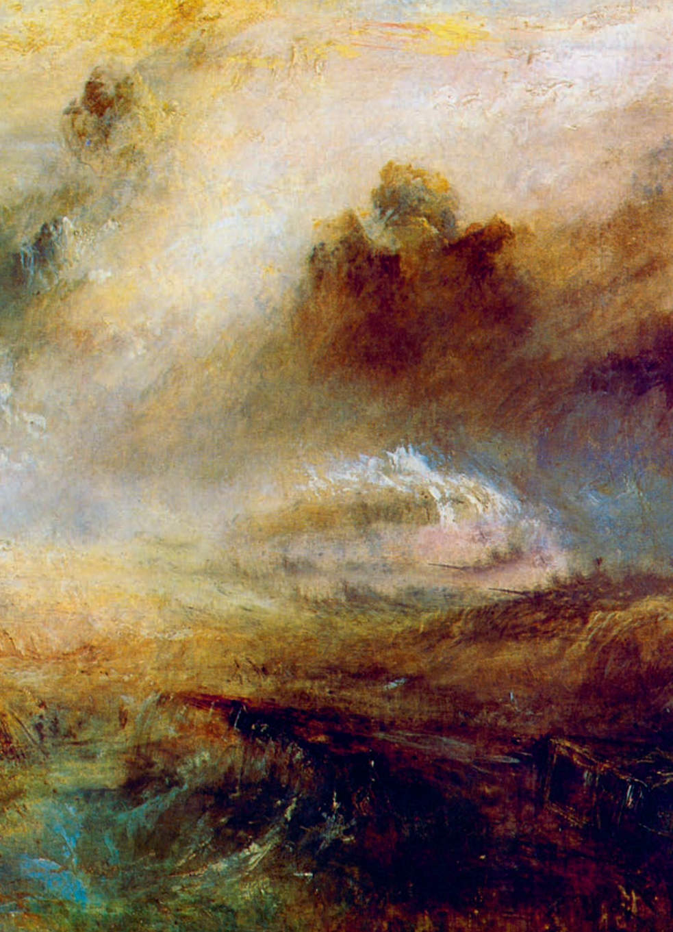
»Raue See mit Wrack«, Gemälde von William Turner, zwischen 1840 und 1845

Walter 1910 die musikalische Leitung. Zwei Jahrzehnte später erinnerte er sich Smyth gegenüber: »Ich fühle immer noch die Faszination der [Schluss-]Szene von Thurza und Marc, den Duft der See [und] die große Leidenschaft in der musikalischen Sprache Ihres Werkes.«