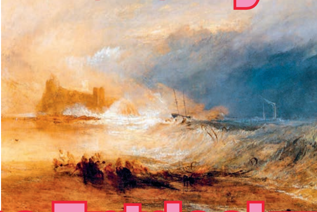
»Wreckers, Coast of Nothumberland«, Gemälde von James Mallord William Turner, um 1836