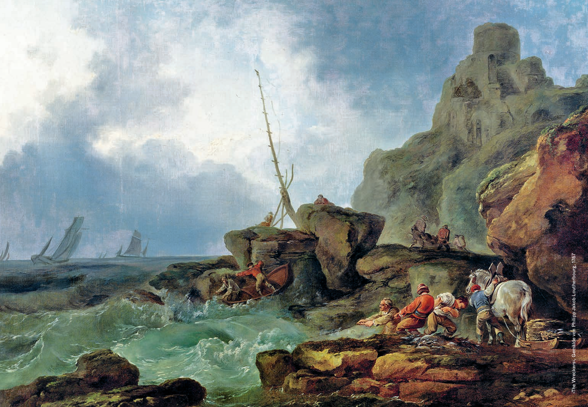
The Wreckers; Gemälde von Philipp Jakob Louterbourg, 1767