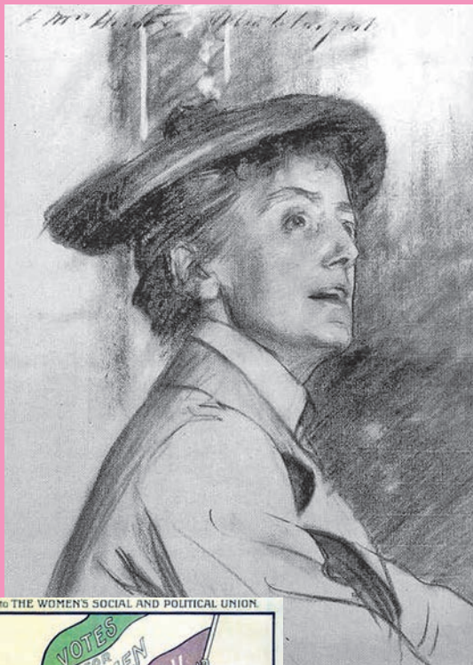
Ethel Smyth, Kreidezeichnung von John Singer Sargent, 1901

Eine späte Premiere. Zum ersten Mal in seiner Geschichte führt das DSO ein Werk von Ethel Smyth auf. Sie war eine Zeitgenossin von Edward Elgar, Gustav Mahler, Claude Debussy und Richard Strauss. Die Ausbildung zur Komponistin trotzte sie ihrem Vater durch Hungerstreik ab. Dass Emanzipation ungewöhnliche bis drastische Maßnahmen verlangt, bewies sie in ihrem Engagement für die Frauenrechtsbewegung. ›Les Naufrageurs‹ war ihre dritte Oper. Die ersten beiden bewegten sich in der deutsch-romantischen Tradition, von der sie bei ihrem Studium in Leipzig umgeben war. Mit ›Les Naufrageurs‹ befreite sie sich davon. Die Handlung spielt an der Küste von Cornwall in einem verarmten Fischerdorf. Die Bewohner löschen bei stürmischem Wetter die Leuchtfeuer auf den Klippen. Seefahrer verlieren so die Orientierung, ihre Schiffe stranden oder zerschellen. Die Fracht nehmen die Dörfler als Beute, Überlebende bringen sie um. Der Ortsgeistliche treibt sie dazu an: Dies sei die Ernte, die Gott ihnen durch die See beschere. Seit einiger Zeit bleibt sie aus. Der Geistliche macht Gottlosigkeit dafür verantwortlich. Am